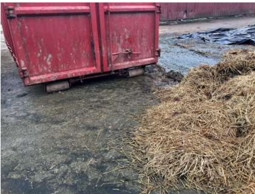
Figur 4: Container til afhentning af gødning og dybstrøelse (foto: SEGES Innovation).

Der blev observeret containere til afhentning af gødning og dybstrøelse, som ikke var vasket grundigt, før de blev leveret til gården. Sådanne containere bliver ofte sat direkte på jorden eller oveni gødningsforurenede områder for at det skal være praktisk at fylde dem op (Figur 4). Efter brug bliver de kørt til en anden bedrift, og det kan ske uden at de bliver tilstrækkeligt rengjort. Ikke mindst undersiden af containere er vanskelige at rengøre, men de udgør en ikke-ubetydelig risiko, hvis de har været i direkte kontakt med miljøet på de ejendomme, de har været i.