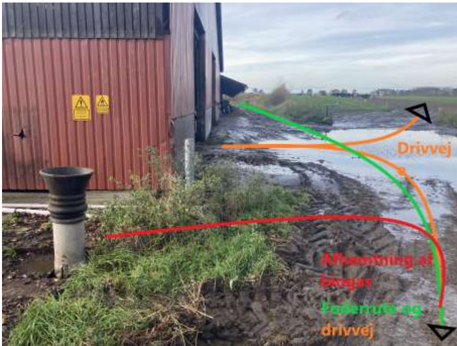
Figur 3: Krydsende, våde/mudrede og urene kørselsveje for gyllevogn, foderrute og drivveje for køer. Køerne er opstaldet i bygningen og foderbordet løber på ydersiden af bygningen sammen med kørselsvejen for foder. Ved afhentning af gylle køres der igennem samme spor. Denne praksis vurderes som minimum at udgøre en øget risiko for smittespredning indenfor bedriften, og det kan ikke udelukkes at smitte kan føres ind på og/eller ud af bedriften via dette krydsfelt (foto: SEGES Innovation).

Der blev observeret containere til afhentning af gødning og dybstrøelse, som ikke var vasket grundigt, før de blev leveret til gården. Sådanne containere bliver ofte sat direkte på jorden eller oveni gødningsforurenede områder for at det skal være praktisk at fylde dem op (Figur 4). Efter brug bliver de kørt til en anden bedrift, og det kan ske uden at de bliver tilstrækkeligt rengjort. Ikke mindst undersiden af containere er vanskelige at rengøre, men de udgør en ikke-ubetydelig risiko, hvis de har været i direkte kontakt med miljøet på de ejendomme, de har været i.