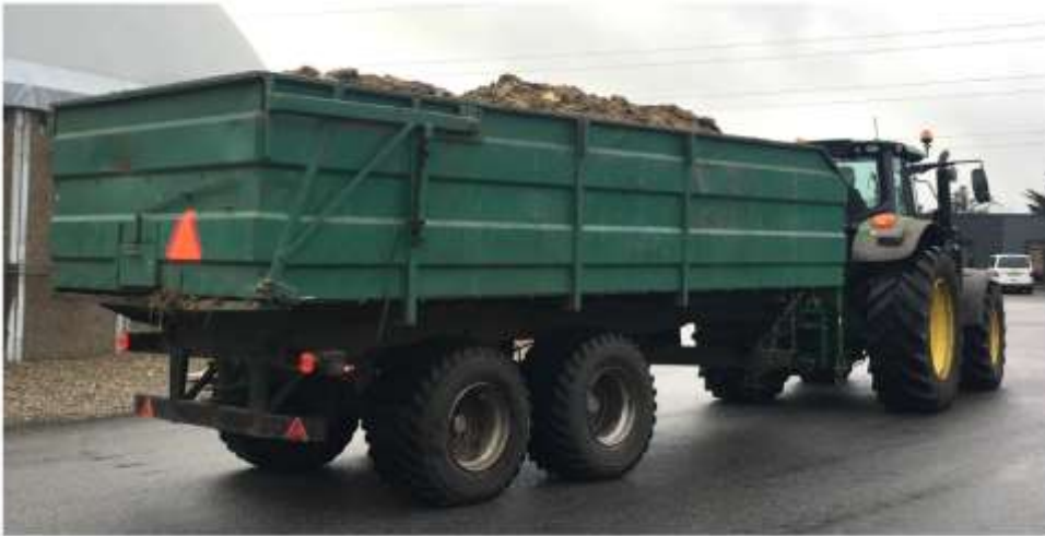
Figur 5: Landmand med egen traktor med åbent lad ankommer med gødning/dybstrøelse til biogasanlæg (foto: IVH-KU).

Det skal påpeges, at gode smittebegrænsende procedurer altid bør benyttes uanset salmonellastatus, da besætninger kan være smittede uden at være blevet opdaget i overvågningsprogrammet endnu (dvs. 'falsk negative Niveau 1-besætninger'). Endelig vil god smittebeskyttelse og hygiejne også forebygge spredning af andre infektioner, der kan være tabsvoldende eller zoonotiske.