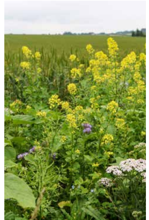
Langs markerne stod der blomsterstriber

Langs nogle af markerne var der sået blomsterstriber. Blomsterne understøtter biodiversiteten og tilbyder næring til bier og andre