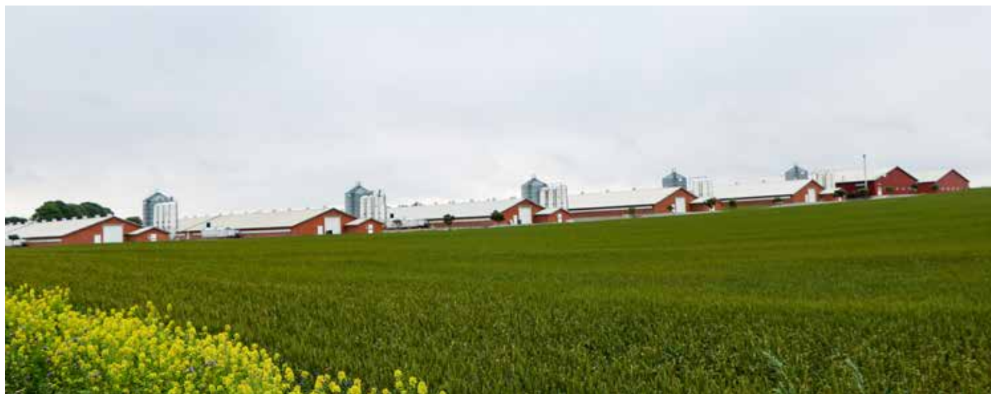
Nogle af Rokkedahls flotte kyllingehuse, de her forventes fremtidig omlagt til økologisk produktion

Herefter gik turen i bil ud til de store markarealer. Rokkedahl dyrker ikke nogen afgrøder til deres konventionelle slagtekyllingeproduktion, men dyrker til gengæld økologiske afgrøder i et omfang der svarer til 70 % af foderet til deres økologiske kyllinger. Dette indebærer i 2022 bl.a. 80 ha med økologisk raps (som i 2023 øges til 160 ha), 500 ha kløvergræs som leveres til biogas. Desuden dyrkes betydelige arealer i 2022 med lupin og byg-ært, vinterrug, vårhvede og havre, i alt 1.800 ha. Rokkedahl leverer råvarerne til Hedegaard Agro/Danish Agro, der producerer, og leverer økologisk slagtekyllingefoder den anden vej.