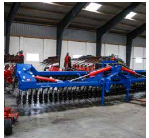
Stjernestriglen er et vigtigt element i ukrudtsbekæmpelsen i markerne