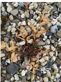
Billede 2: Effekt af Topgun efter 10 dage på en dueurt.