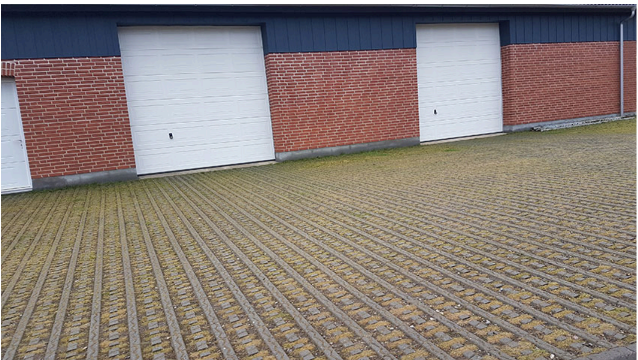
Billede 5. Eksempel på græsarmeringsfliser foran en lade. Det sikrer, at der stadig kan færdes med maskiner, mens græsset kan slås efter behov.

På arealer, der tidligere har været belagt med grus eller perlesten og anvendt som kørevej eller vendeplads, kan der etableres græsarmering. Det sikrer, at der stadig kan køres på områderne med maskiner, mens der i hullerne sås en langsomt voksende græsblanding, der kan slås efter behov.