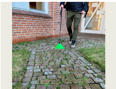
Billede 1. Ukrudtsbekæmpelse med pelargonsyre på befæstet areal. Der skal sprøjtes til fuld dækning af ukrudtet. Skærmen sikrer mod afdrift til vegetation, som ikke ønskes påvirket.

For at sikre fuld dækning af ukrudtsplanterne og samtidig forebygge mod afdrift anvendes dyser, som giver mellemstore dråber. Ved rygsprøjte kan der kombineres med en skærm, som sikrer mod afdrift (se billede 1). Ved valg af den lille skærm med 20 cm bredde på billedet anbefales en 80 grader dyse (eks. TeeJet 8003 VP). På større arealer kan anvendes mindre sprøjter til ATV eller traktor. Der er også udviklet en specialsprøjte til afskærmet sprøjtning kaldet Weed-IT, der kører med lav vandmængde og spotsprøjter på ukrudt. Maskinen kan anvendes på fortove og parker og kræver store arealer at behandle, da det er en specialmaskine.