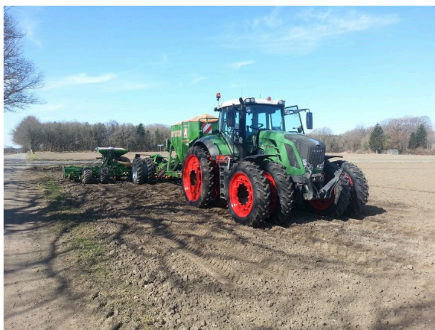
Billede 3. Billedet viser et eksempel på korrekt hjulmontering ved såning af majs på både traktor og såmaskine. Hjulene er monteret, så der ikke sås i hjulsporene. Der er monteret 280 mm brede dæk. En monterning med lidt bredere hjul, 380 mm til maks. 480 mm dæk, kan give dækkene et bedre greb og en større bæreflade. Med en