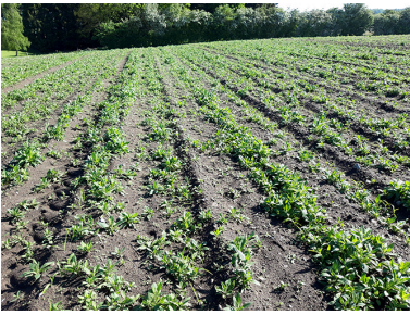
Aftenpragtstjerne bliver ikke bekæmpet med ukrudtsmidlerne i majs.