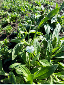
Aftenpragtstjerne har hvide blomster og underjordiske udløbere.