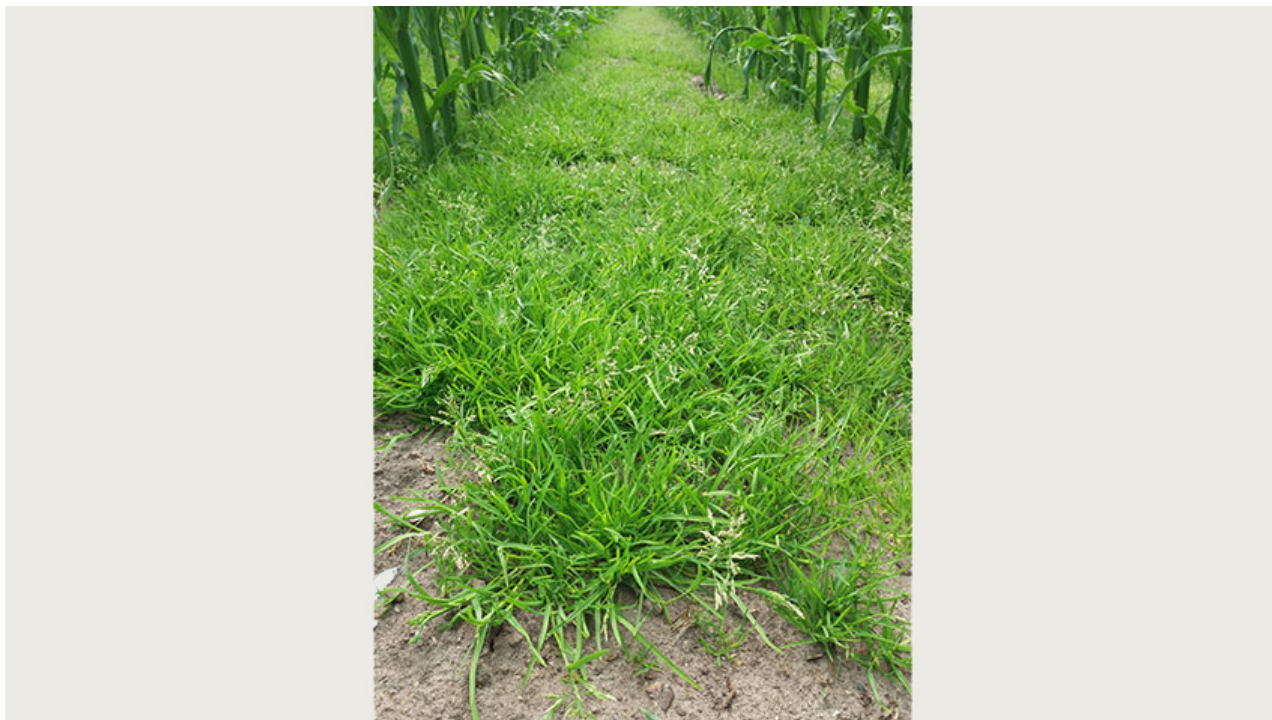
ALS-resistent enårig rapgræs i majs. I marken er der dyrket majs i 8 ud af 9 år, hvoraf der er anvendt MaisTer i 7 år.

Desværre er der en række tilfælde af resistens hos enårig rapgræs over for ALS-hæmmere, herunder MaisTer. Det har ikke været forventet, idet de fleste tilfælde af resistens hos enårig rapgræs hidtil er set på f.eks. golfbaner, hvor der sprøjtes meget hyppigt.