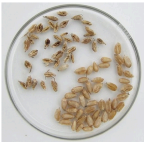
Billede 3. Sunde kerner - henholdsvis kerner, der har været angrebet af orange-gule hvedegalmyg (øverst til venstre).