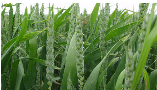
Billede 6. De første småaks er afblomstrede og er ikke længere modtagelige. Dette ses let ved at støvknapperne hænger ud. Blomstringen i akset begynder i midten af akset.