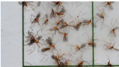
Billede 4. Limplade fra feromonfælde med orangegule hvedegalmyg. Fælderne tiltrækker kun orangegule hvedegalmyg, men andre insekter kan tilfældigvis komme til at klistre på fælden.