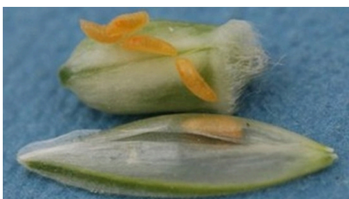
Billede 2. Larver af orange-gule hvedegalmyg på hvedekerner. I den ene kerne kan der skimtes en larve under avnen. Larverne kan findes i aksene omkring de tre første uger af juli.