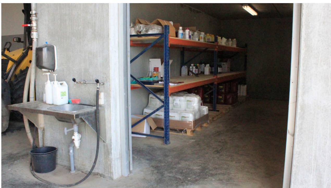
Billede 4. Et velindrettet kemirum med adgang til håndvask giver sammen med personlige værnemidler en høj grad af sikkerhed ved omgang med plantebeskyttelsesmidlerne.