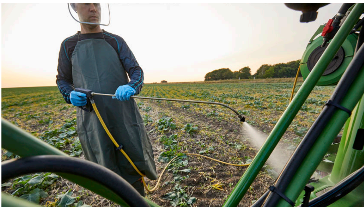
Billede 2: En tilpas stor skyllevandstank og en pumpe, der kan give tilstrækkeligt tryk på vandpistolen, gør det muligt at udføre den udvendige rengøring i marken.