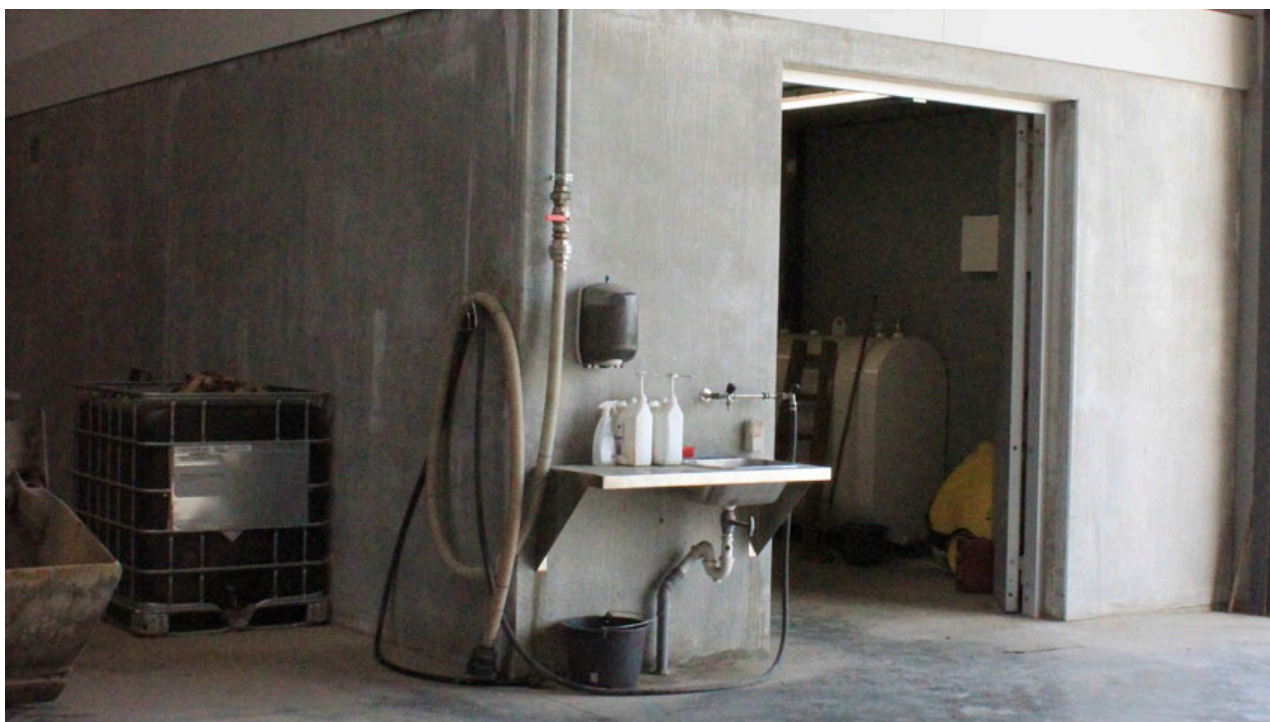
Billede 3. Indretning af indendørs fyldeplads kombineret med rengøring i marken minimerer behovet for opsamling af vaskevand.