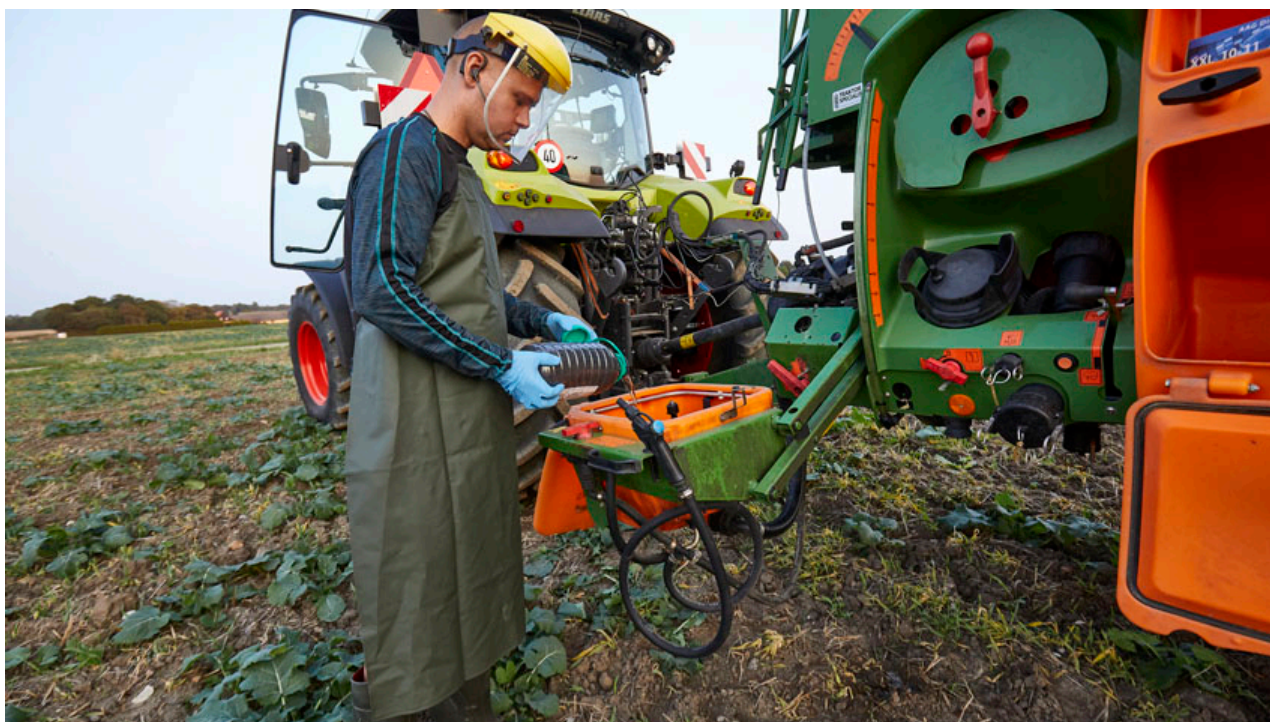
Billede 1: Påfyldning af kemi i marken er en sikker og lovlig praksis for bedrifter, som ikke har mulighed for at benytte en regulær fylde-vaskeplads med opsamling af vaskevand.