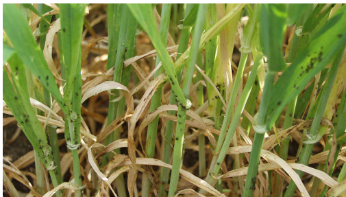
Billede 3. Havrebladlus på stråbasis i vårbyg.