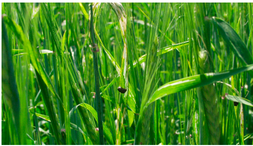
Billede 4. Angreb af kornbladbillens larve i vårbyg.