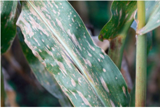
Billede 2. Majsbladplet. Pletterne er aflange og brune eller grå