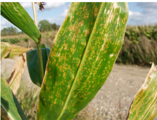
Billede 4. Majsøjeplet.