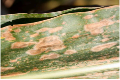
Billede 3. Majsbladplet. Pletterne er aflange og brune eller grå.