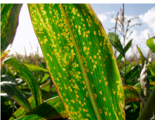
Billede 5. Majsøjeplet. De talrige runde brune pletter med en gul zone omkring er typiske. Symptomerne er især tydelige, når bladet holdes op mod lyset.