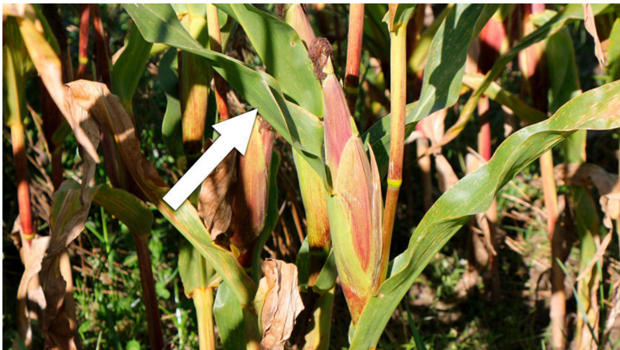
Billede 1. Bekæmpelse i pløjede marker anbefales, hvis over 80 procent af planterne har angreb på bladet, der støtter kolben (se pilen), og der har været mindst 1 risikoperiode. I starten kan det være nødvendigt at skønne, hvor kolben bliver dannet.

Beslutningen om evt. bekæmpelse skal træffes inden sprøjtefristen, som er vækststadium 65 (fuld blomstring) for Comet Pro og vækststadium 69 (afsluttet blomstring) for Propulse. Vækststadium 65-69 forekommer typisk fra ultimo juli til medio august.