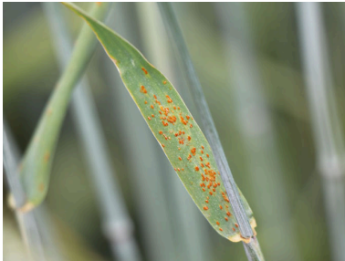
Billede 4. Brunrust i rug.