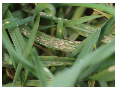
Billede 1. Tidlige angreb af meldug og brunrust i rug.

Se svampemidlernes effekt, antal tilladte behandlinger mv. i dyrkningsvejledningen Vejledning i bekæmpelse af svampesygdomme i korn.