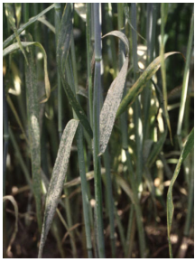
Billede 2. Meldug i rug.