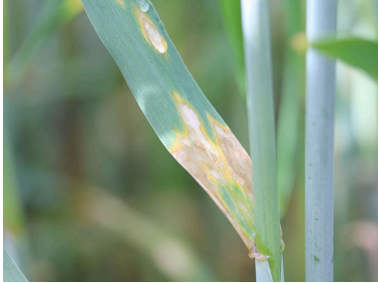
Billede 3. Skoldplet i rug. Bladpletterne er lysere end ved skoldplet i byg.