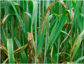
Billede 7. Skoldplet.