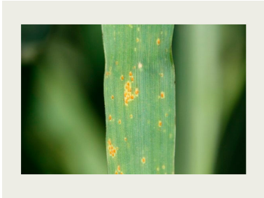
Billede 2. Nærbillede af bygrust.