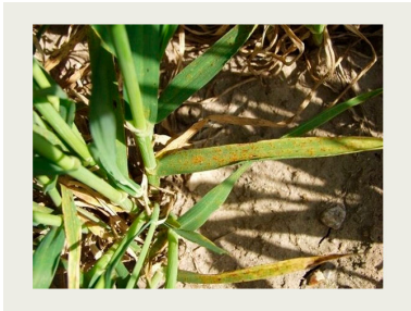
Billede 3. Bygrust på de nederste blade.