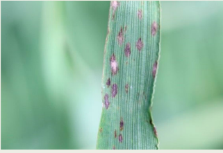
Billede 6. Bygmeldug. De brune pletter er afværgereaktioner mod meldug.