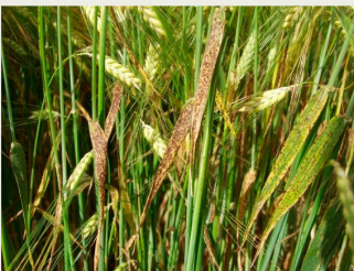
Billede 10. Ramularia. Her ses meget sene angreb.