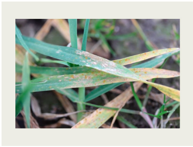
Billede 1. Tidlige angreb af meldug og bygrust i vinterbyg.