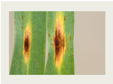
Billede 5. Plettypen af bygbladplet.