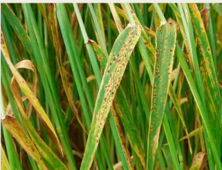
Billede 9. Ramularia. I forsøgene har der ikke været nogen god sammenhæng mellem angreb og opnåede merudbytter ved svampesprøjtning.