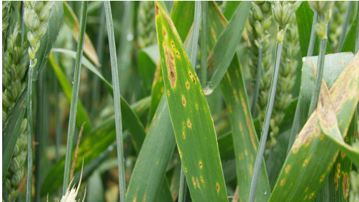
Billede 3. Ældre og nye angreb af hvedebladplet på fanebladet.