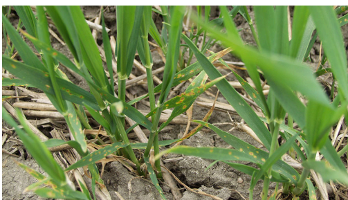
Billede 1. Hvedebladplet smitter fra halmrester af hvede.

I landsforsøg med naturlig smitte er der med 50-75 procent dosering under blomstring kun opnået 35-50 procent reduktion af toksinindholdet.