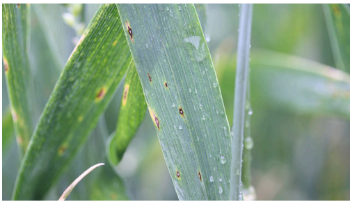
Billede 2. Helt tidlige angreb af hvedebladplet på fanebladet.