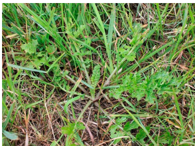
Billede 1. 1. års engbrandbæger i rosetstadiet sidst i juni.

Engbrandbæger er to- til flerårig. Engbrandbæger spirer primært frem om foråret og bruger det første år til at danne en roset. Blomstringen sker i juli-august i plantens 2. leveår. Den sikreste bekæmpelse er at anvende Harmony mod førsteårsplanterne i august.