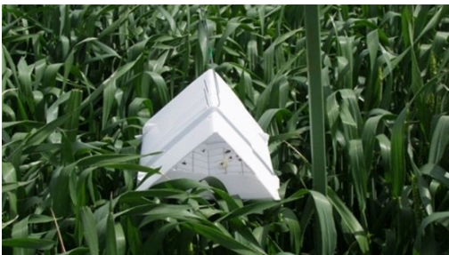
Billede 5. Feromonfælde til at følge forekomsten af orangegule hvedegalmyg.