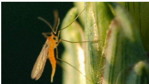
Billede 1. Hun af orange-gul hvedegalmyg i hvedeaks. Hunnen er ved at gøre klar til at lægge æg med bagkroppen.

Vær også opmærksom på evt. angreb i vårhvede, som blomstrer senere, og hvor der derfor oftere er sammenfald mellem flyvning og et modtageligt udviklingstrin end i vinterhvede.