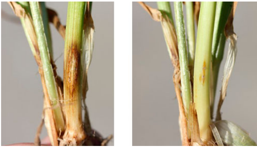
Billede 2. Angreb af knækkefodsyge på hvede. Til venstre ses angreb på yderste bladskede. Til højre er yderste bladskede fjernet, og her ses også angreb på 2. yderste skedeblad. Planten tæller derfor med som en angreben plante.