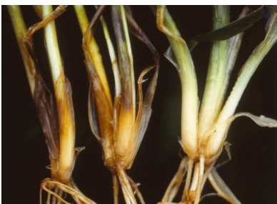
Billede 1. Knækkefodsyge i hvede i foråret. Til højre ses en uangreben plante.

Knækkefodsyge kan overleve op til tre år på planterester af korn. Angreb ses derfor i marker med vintersædsdyrkning inden for de sidste to år.