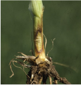
Billede 3. Efterhånden bliver symptomerne på angreb af knækkefodsyge mere tydelige og ligner et øje.