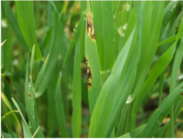
Billede 3. Bybladplet optræder både som plettypen og nettypen. Nettypen, som ses på billedet, er mest udbredt.