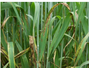
Billede 6. Skoldplet.