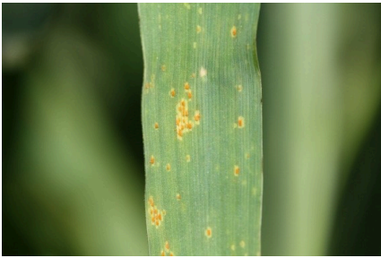
Billede 2. Nærbillede af bygrust.