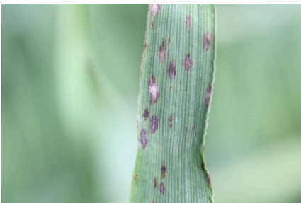
Billede 5. Bygmeldug. De brune pletter er afværgereaktioner mod meldug. Af de dyrkede sorter er kun Focus modtagelig for meldug.