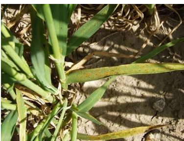
Billede 1. Bygrust på de nederste blade.

* Bemærk, at løsninger kun må bruges til vækststadiene, som er angivet i løsningsforslagene.