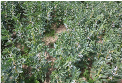
Udsædsmængde med 20 planter pr. m 2

Radrensning i hestebønner. Det er vigtigt med præcis indstilling af rækkeafstand, så radrensningen kan ske så tæt på rækken som muligt.