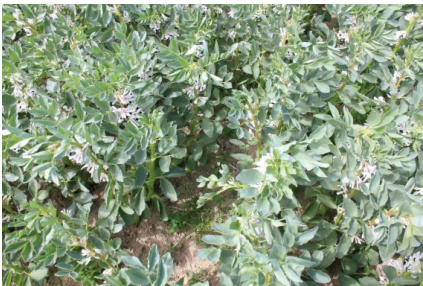
Hestebønners udsædsmængde med 40 planter pr. m 2