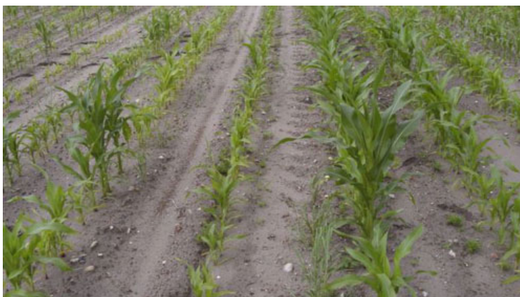
Dyrkning af majs på sandjord første år efter flere år med korndyrkning kan give uens vækst i majs. En af årsagerne kan være skade af havrecystenematoder på majsrodderne.

Er der kun få marker, der egner sig til majs, kan majs dyrkes i monokultur, men der kan efter få år opstå problemer med rodukrudt som agerpadderokke, følfod, vandpileurt og tidsel.