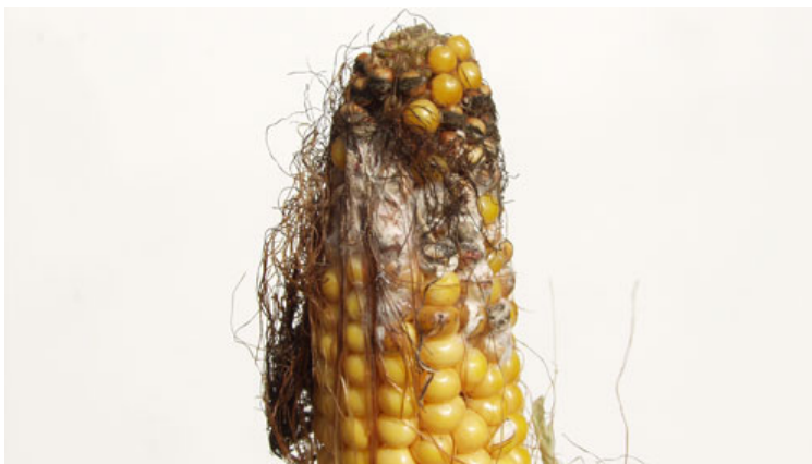
Smitten med fusarium sker omkring hunplantens blomstring (blomstrer omkring 1. august), hvor støvfang skaber indfaldsvej.

Fusariumsvampene er uønskede, fordi de producerer toksiner. Kernemajs bruges til fodring af grise, og grise er væsentlig mere følsomme for Fusariumtoksiner end kvæg. De vejledende grænseværdier er ca. 5 gange lavere til grise end til kvæg.