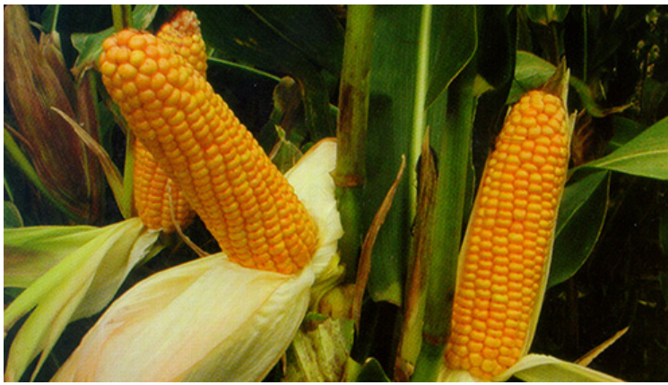
Kernemajs.