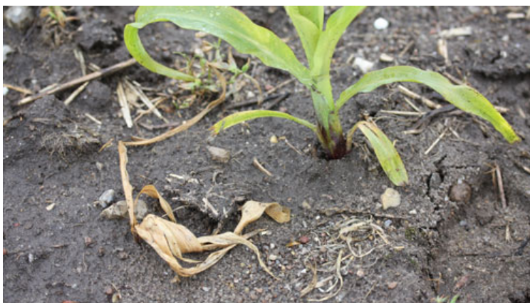
Majsplante angrebet af smældere til venstre.

Smældere lægger æg i græsbevokset jord. Larverne har en 4-årig udvikling. Jo flere år med græs, jo flere år kan der lægges æg. Efter et års græsdyrkning ses normalt kun svage angreb i den efterfølgende afgrøde, fordi der kun er lagt æg i et år. Angreb er som regel værst 2. og 3. år efter opløjning af græsset, fordi larverne det første år kan leve af det opløjede materiale.