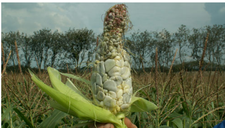
Symptomerne er glinsende grønne til sølvhvide galler, der er fyldt med sorte brandsporer. Angriber især stressede planter.

Jo senere høst jo mere er planterne oftest angrebet af Fusarium.