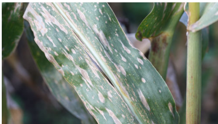
Majsbladplet. Farven på bladpletterne kan variere fra mørkebrun til lysebrun eller være mere grålig.

Marker med reduceret jordbearbejdning og samtidig forfrugt majs er mest udsatte for angreb, fordi smitstof af majsbladplet og majsøjeplet overlever på planterester af majs. I pløjede marker anbefales bekæmpelse, hvis over 80 procent af planterne har angreb på bladet, der støtter kolben. Se billede nedenfor. Der skal samtidig have været mindst én risikoperiode (mindst 36 sammenhængende timer med bladfugt) for at udløse bekæmpelse. I upløjede marker med forfrugt majs er risikoen for kraftige