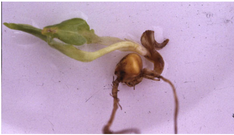
Spiringsfusariose i majs. Spiren krøller og ligner en "proptrækker".

Senere kan stænglerne og kolberne blive angrebet.