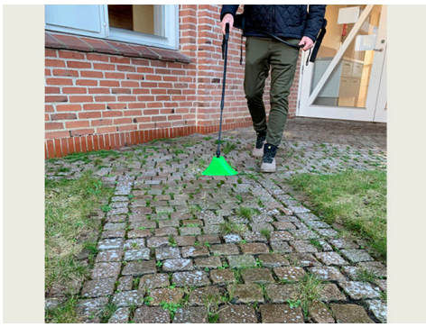
Billede 1. Ukrudtsbekæmpelse med pelargonsyre på befæstet areal. Der skal sprøjtes til fuld dækning af ukrudtet. Skærmen sikrer mod afdrift til vegetation, som ikke ønskes påvirket.