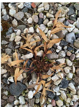
Billede 2. Effekt af Topgun efter 10 dage på en dueurt.