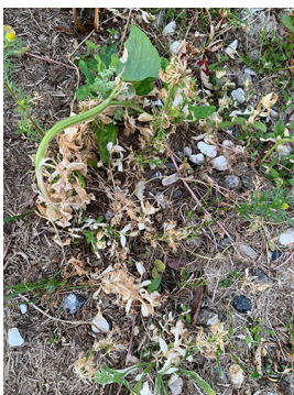
Billede 3. Effekt af Topgun efter 10 dage på stort ukrudt. Bemærk hvor vigtigt det er at dække alle dele af planten. Den hvidmelede gåsefod er kun ramt på nedre stængel og gror videre i toppen.