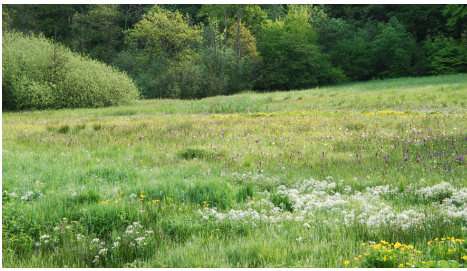
§3-beskyttet natur i Lisbjerg i maj, hvor blomsterne står i fuldt flor