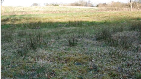
Samme område om vinteren, hvor blomsterne er væk, og naturværdierne, der medfører at arealet er beskyttet, er sværere at få øje på.