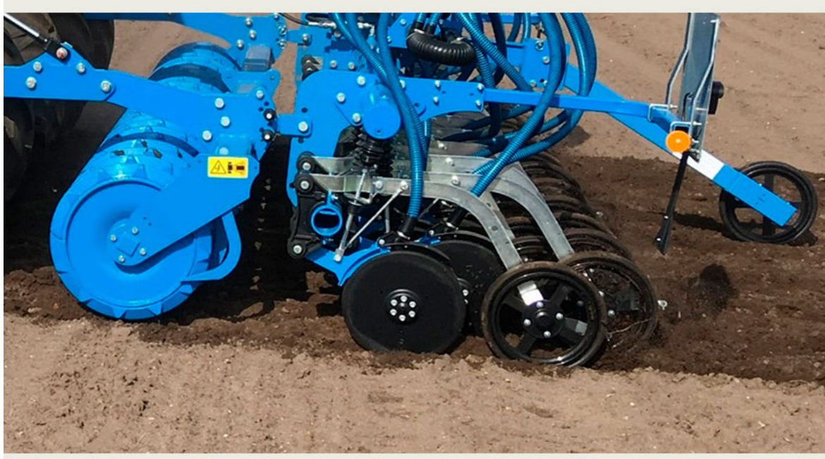
Billede 1. Såteknik med pakvalse, dobbelte skiveskær og trykrulle i såsporet er velegnet til etablering af kløvergræs. Desværre er der mange, der også sår for dybt med den nye teknik, så indstil såmaskinen korrekt. Man må gerne kunne se cirka 10-15 pct. af frøene i såsporet efter såning.

Såning med frøåskasser, hvor frøene udspreddes på jordoverfladen ved samtidig såning af dæksæd, er en usikker etableringsmetode – især i forår, der er nedbørsfattig. Græsfrøene skal placeres på fast og fugtig jord i bunden af såsporet. På løs jord, under tørre forhold eller på svær lerjord er det vanskeligt at gennemføre en korrekt placering af frøene. Udlæg af ital. rajgræs kan sås i blanding med dæksæden.