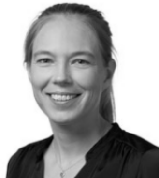
Miljø – hydrologi og grundvand