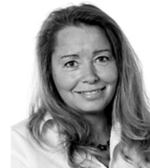
Projektleder + koordinator