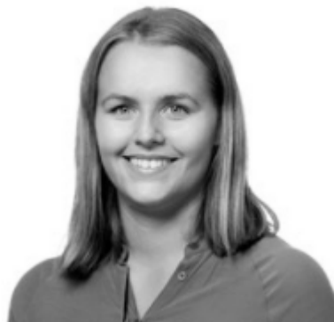
Økonomi og erstatning