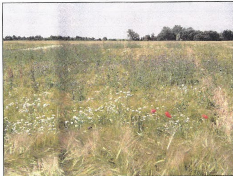
Billede 3. System C på lerjord efter 5 år. Upløjet jord uden brug af pesticider. Som i system A ses det her tydeligt, at rodukrudt er et uoverkommeligt problem.