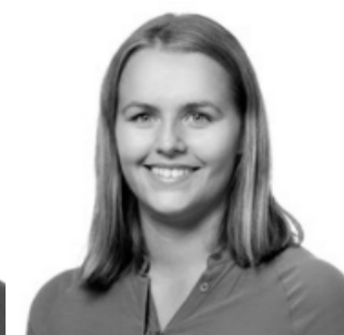
Økonomi og erstatning $$$