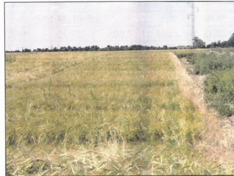
Billede 4. System D på lerjord efter 5 år. Upløjet jord med brug af pesticider. På dette tidspunkt er det svært at se forskellen mellem system B og D.