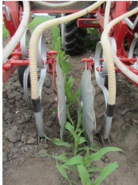
Billede 1. Billedet viser gødningsudstyr, monteret på en radrenser. Gødningen lægges i jorden 10 til 15 cm fra rækken bag den yderste tand på radrenseren. Gødningen kan enten placeres på den ene side af rækken eller på begge sider af rækken som vist på billedet.

Nedfældning af flydende ammoniak kan for eksempel ske i forbindelse med radrensning. Ammoniakken nedfældes i 10 cm dybde og 20 cm fra rækken.