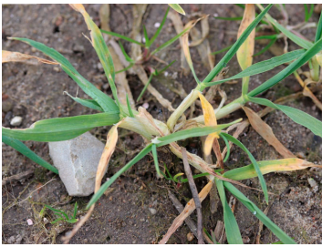
Billede 7. Angreb af bygfluens larve i vinterbyg i foråret.