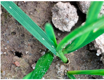
Billede 2. Tre bygflueæg.