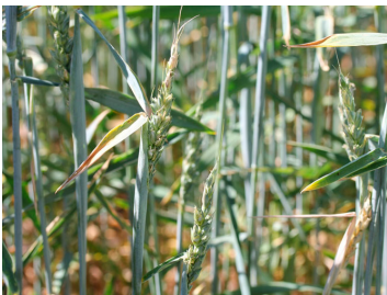
Billede 4. Deforme aks i vårhvede pga angreb af bygfluer. Strållængden er lavere på de angrebne skud, så afgrøden får ved angreb et meget uensartet udseende grundet mange forskellige strållængder.