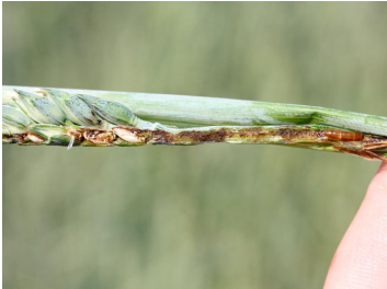
Billede 3. Angreb af bygfluer i vårhvede. Bemærk gnavet fra akset og nedad stænglen. Til højre ses puppen.