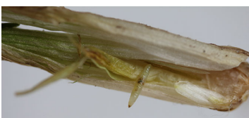
Billede 5. Larve af bygflue. Larven er hvid, lemmeløs og har en sort mundbrod.