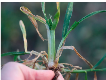
Billede 6. Angreb af bygfluens larver i rug fotograferet om foråret.