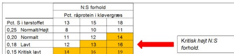
Tabel 3. Indhold af svovl og N:S forhold i kløvergræs ved første og anden slæt

Vurderes behovet for svovl ud fra en planteanalyse, skal man også tage hensyn til N/S forholdet, se nedenstående skema. Er N/S forholdet under 12 til 13, vil det næppe medføre et tab af udbytte.