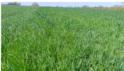
Billede 1. Italiensk rajgræs med skinnende blade ses tydeligt i hveden. I forageren er den på vej til at vokse over hvede.

Tilsvarende kan der være marker med tætte bestande af agerrævehale eller væselhale, som endnu ikke syner af så meget, men vil udvikle sig og give samme udbyttetab og kaste en enorm mængde frø, som vil give problemer i årene fremover.