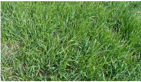
Billede 2. Kraftig vækst af italiensk rajgræs på vej til at koste et stort udbyttetab i hvede. Italiensk rajgræs er her resistent over for ALS-midler som Cossack og Broadway.

Såtidforsøg i vårbyg viser, at udbyttet falder kraftigt ved såning i maj (figur 1). Men er bestanden af græsukrudt i områder af marken så stor, at den allerede nu sidst i april er ved at vokse over afgrøden, er der stadig indtil først i maj mulighed for at nedvisne afgrøde og græs med glyphosat og så vårbyg i efter ca. 5 dage.