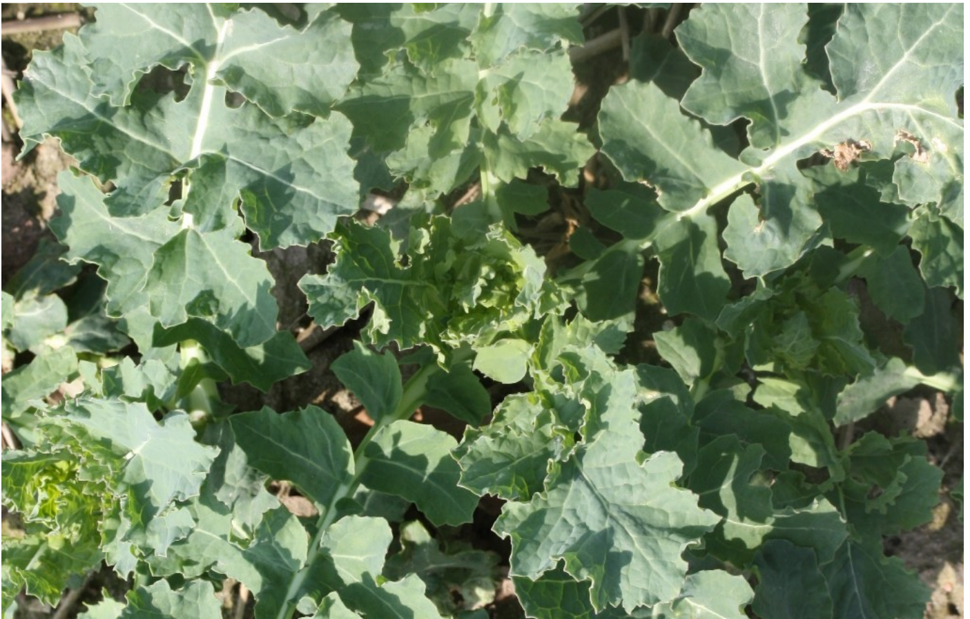
Billede 1. Denne rapsplante er meget tæt på stadium 50. Tjek nøje rapsens stadium inden eventuel behandling med Galera eller Korvette, og sprøjt aldrig efter stadium 50.