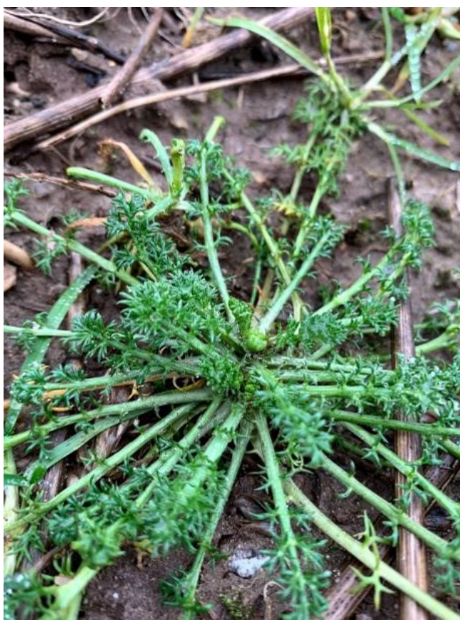
Billede 3. Kamille behandlet med Belkar i efteråret. Der ses krøllede blade og sukkulente stængler.

På billede 3 ses en kamille behandlet med Belkar i efteråret. Kamille får krøllede blade og sukkulentagtige stængler, men planten vil oftest kunne findes i marken grøn til foråret. Er der en konkurrencestærk afgrøde vil kamillen ikke udvikle sig yderligere. I områder med tyndere plantebestand bør antallet af kamille vurderes og evt. foretages en pletsprøjtning.