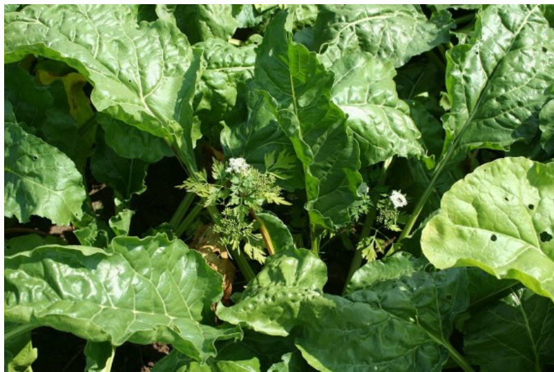
Billede 1. Hundepersille har en lang fremspiringsperiode og er relativt vanskelig at bekæmpe. Målet med ukrudtsbekæmpelsen er, at dækningen af ukrudt under eller over afgrøden i august er under 10 procent.

En svensk forsøgsserie har vist størst skånsomhed over for roerne ved radrensning tidligt frem for sent. Når radrenseren kommer ind på 2-4 centimeter fra rækken sker der mindre skade på rødder og blade, mens roerne er mindre. Det foreslås derfor at radrensning udføres mellem 2. og 3. sprøjtning efter fremspiring frem for efter, at den kemiske bekæmpelse er afsluttet.