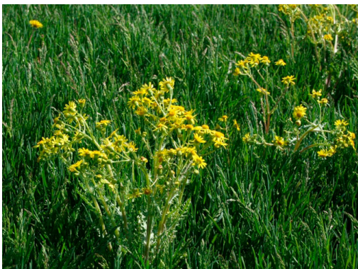
Billede 3. Vårbrandbæger blomstrer allerede i april-maj.

Vårbrandbæger er enårig og er helt overvejende vinterannuel (spirer frem om efteråret og blomstrer næste forår). Fremspiringen sker, når jorden er fugtig i månederne juni-september, og der udvikles en roset frem til vinteren. Planten er meget tidligt i vækst om foråret og blomstrer i maj og juni.