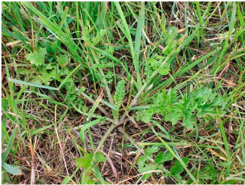
Billede 1. 1. års engbrandbæger i rosetstadiet sidst i juni.

bekæmpelse er at anvende Harmony mod førsteårsplanterne i august.