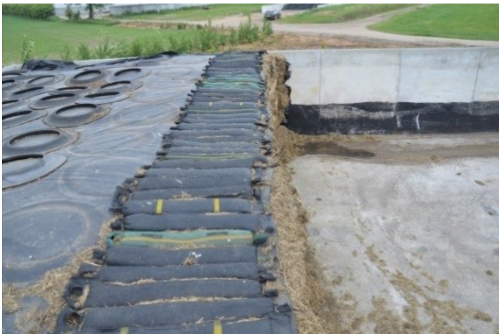
Billede 3. Sække med småsten – side mod side – langs snitfladen under opfodring er en mere sikker metode end dæksider til at forhindre luft i at trænge ind under plastfolien under opfodring. Sækkene giver et stort og ensartet tryk i 1 meters bredde og forhindrer effektivt luft i at trænge ind under plastfolien under opfodring. Vend håndtaget væk fra snitfladen, så sækkene kan trækkes, når de skal flyttes.