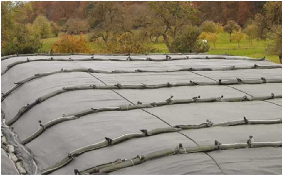
Billede 2. Sække med småsten er effektive til at forhindre, at luft kan trænge ind under plastfolien. Sækkene lægges ende mod ende med 4-5 m imellem rækkerne. Langs kanten – og helt ud til kanten - lægges 1-2 rækker sække ende mod ende, som skal klemme vulken flad, så luft ikke kan sive langs kanten og op under plastfolien.