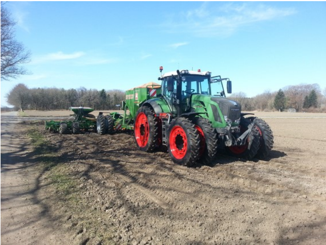
Billede 3. Billedet viser et eksempel på korrekt hjulmontering ved såning af majs på både traktor og såmaskine. Hjulene er monteret, så der ikke sås i hjulsporene. Der er monteret 280 mm brede dæk. En montering med lidt bredere hjul, 380 mm til maks. 480 mm dæk, kan give dækkene et bedre greb og en større bæreflade. Med en rækkeafstand på 75 cm skal sporvidden mellem de inderste hjul være 1,5 meter. Sporvidden mellem de yderste hjul skal være 3,0 meter. Afstandene er fra midthjul til midthjul.