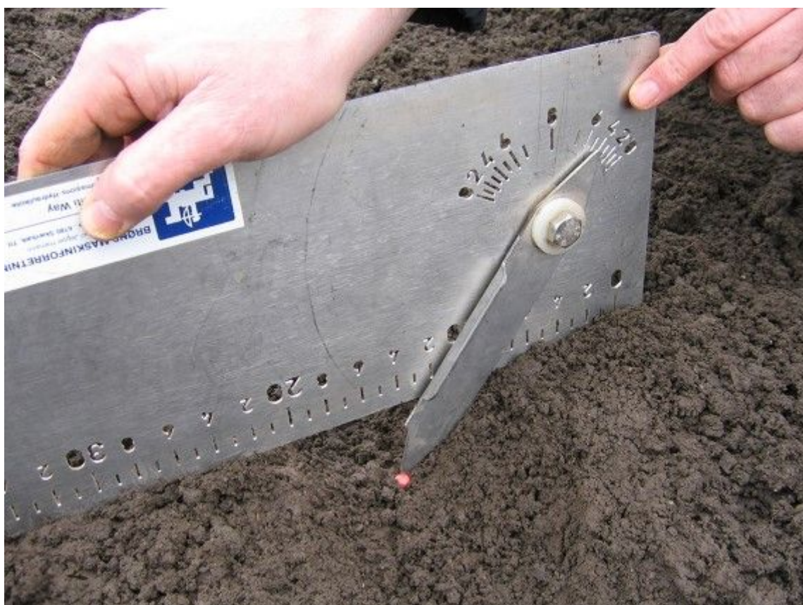
Billede 2: Billede 1 og 2, Tjek frøafstand og sådybde efter alle såhuse flere gange under såningen. Amazone har udviklet en handy plade (billederne), der kan skrabe jorden væk over frøene i såsporet, og måle frøafstanden og måle sådybden. Pladen kan købes hos Brøns Maskinforretning ApS i Skærbæk tlf.: 74753112