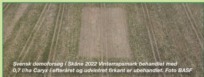
Svensk demoforsøg i Skåne 2022 Vinterrapsmark behandlet med 0,7 l/ha Caryx i efteråret og udvintret firkant er ubehandlet.

Raps etableret 1. august begynder sin strækningsvækst noget tidligere end raps etableret 20. august. Derfor har tidligt sået raps, behov for en vækstregulering, der virker længere, og doseringen skal derfor være højere.