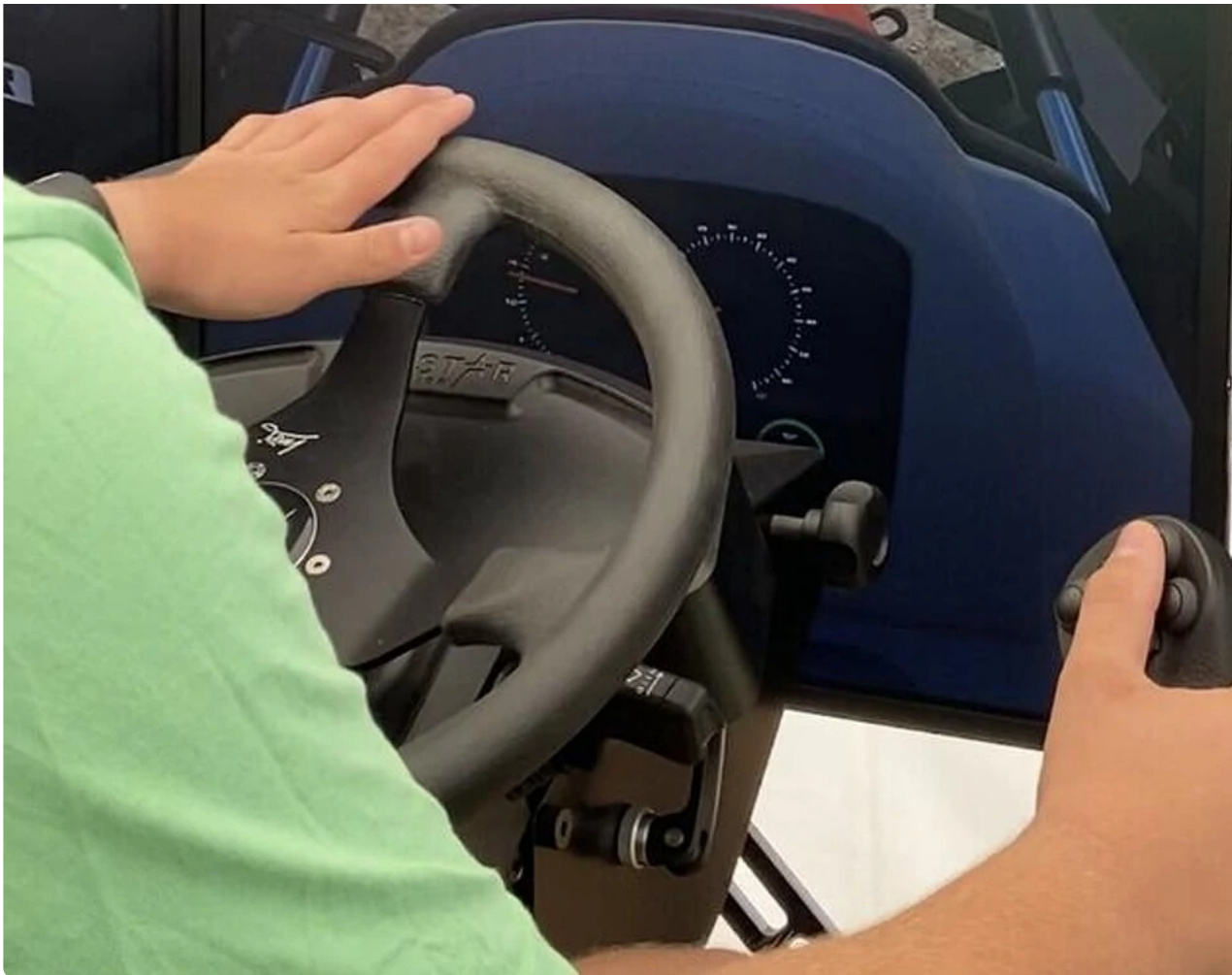
Tre fremadrettede skærme, rat og joystick.