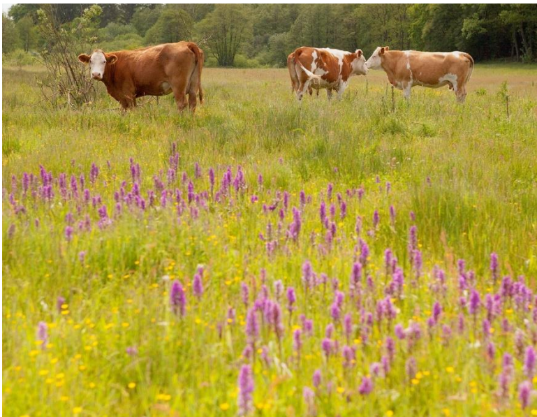
Naturpleje + Grundbetaling + støtteordninger

Fremtidig pasning af vådområde- og lavbundsarealer – samarbejde med energi- og forsyningssektoren?