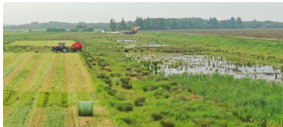
Dyrkning af sumpkulturer + Grundbetaling fremefter + ???

Vil det være tilladt fremefter. Lige nu kun med artikel 32/4