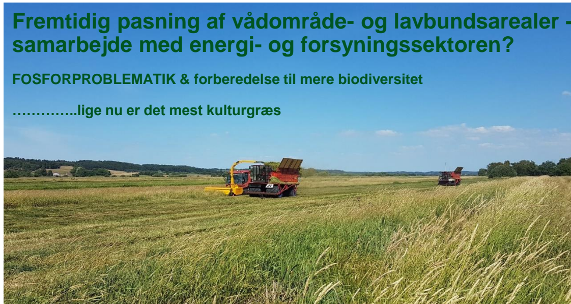
Naturpleje ved biomassehøst + Grundbetaling + ?