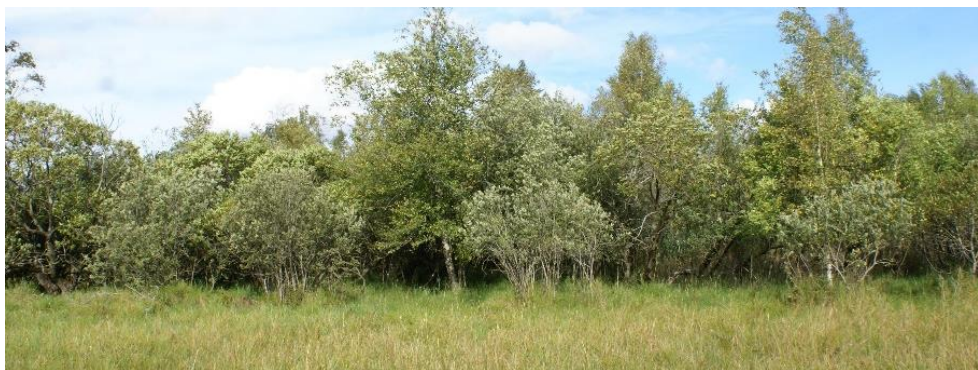
Tilgroning → (Grundbetaling ?)

Vil det være tilladt fremefter. Lige nu kun med artikel 32/4