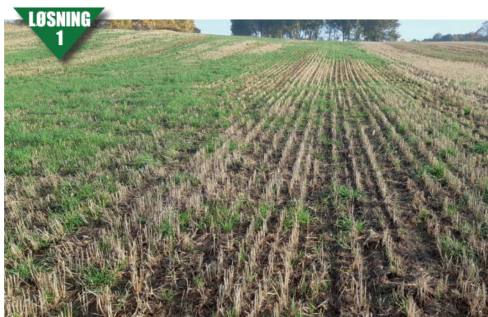
Marken har efter høst ligget uberørt indtil 19. september, hvorefter der er harvet øverligt i 3-4 centimeters dybde med en discharve.

Han harvede i november med tallerkenharve som vinterharvning. Det var tydeligt at se, at der var en del tuer af rajgræs tilbage fra sidste års overlevende rajgræsplanter. Det er også tydeligt ved besigtigelse i marts, at harvning har fremprovokeret en ny spiring af rajgræs. Udfordringen er, at harvningen har dækket nogle af rajgræstuerne. Men en mild vinter kan få dem fri af jord, så forårets glyphosatsprøjtning kan bekæmpe dem.