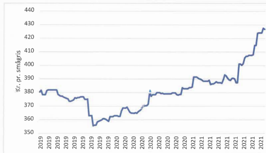
Figur: Nulpunktpriser i den beregnede smågrisenotering.

Det er selvfølgelig forskelligt fra virksomhed til virksomhed, hvor meget det er muligt at omkostningsoptimere – hvis det overhovedet er muligt – men det er et vigtigt fokusområde både ud fra et økonomisk og managementmæssigt perspektiv. Herudover er det også et område, der er vigtigt for de finansielle partnere i grise-sektoren, så det kan også bidrage til en god dialog med banken, hvor det pointeres, at der er opmærksomhed på området.