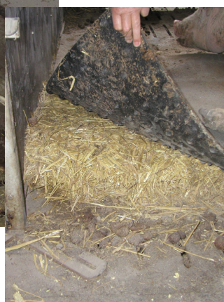
Under gummimåtte er fastgjort en skumkile. Alternativt kan der etableres fald på det faste gulv eller der kan benyttes et stempelslag halm

halmmåtte eller gummimåtte med skumkile. Nedenfor beskrives de forskellige måder til etablering af blødt leje i sygestien, der alle opfylder gældende lovgivning.