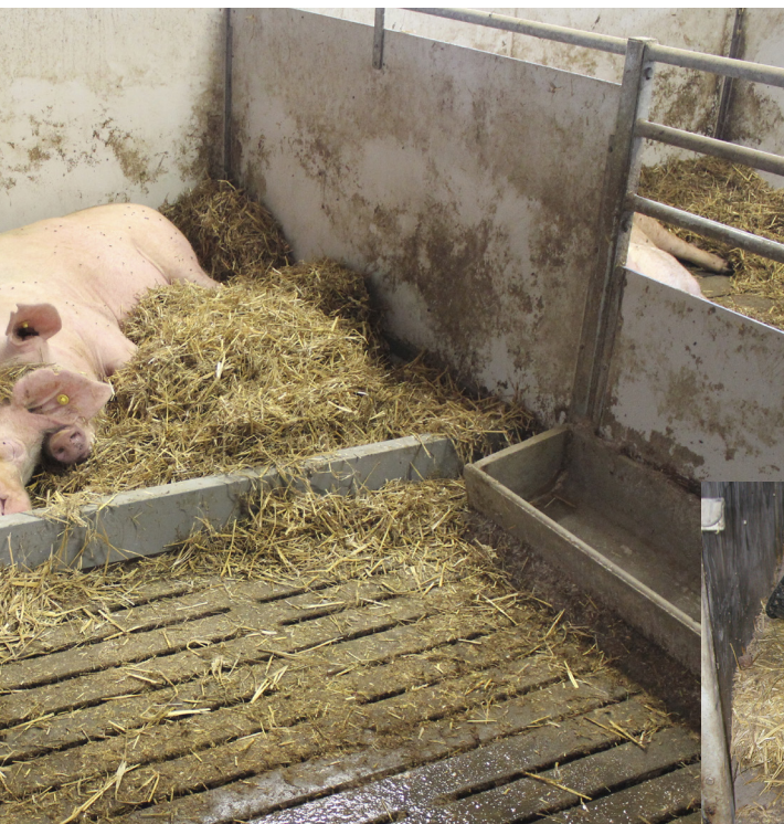
Eksempel på etablering af strøet, drænet halmmåtte i søernes leje. Et bræt holder på halmen i lejet, mens spaltegulvet i gødeområdet holdes frit for halm. Der må være til og med tre søer i en sygesti.