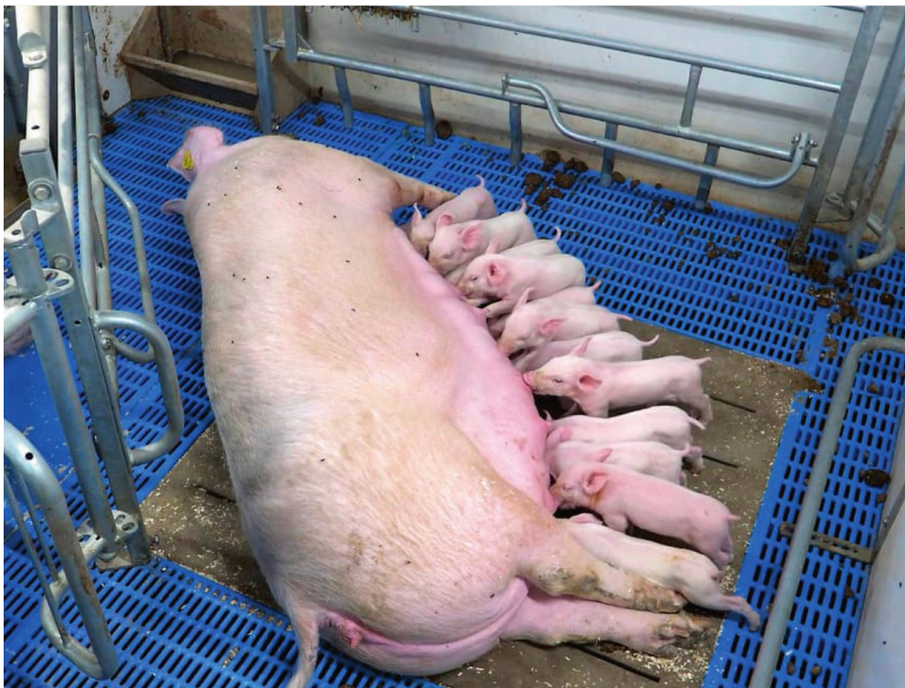
En faresti fra den første stald, hvor der blev foretaget emissionsmålinger.